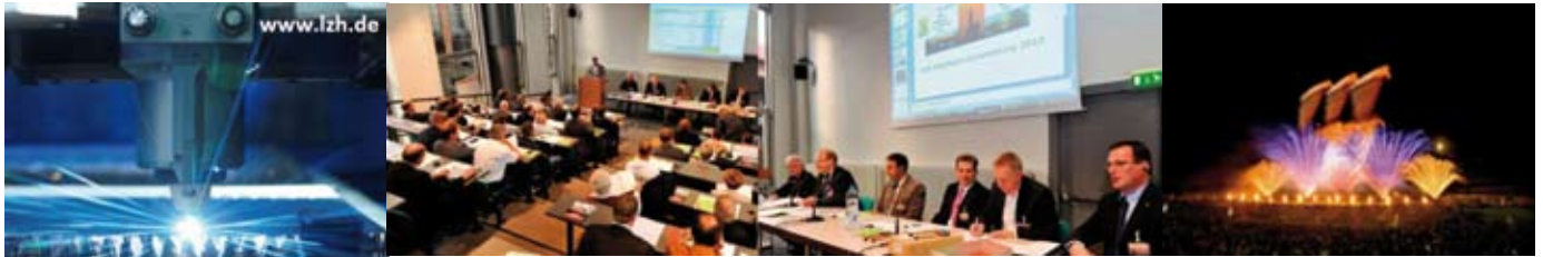
FdS- und ESU-Mitgliederversammlungen / General Meeting 2014 in Hannover